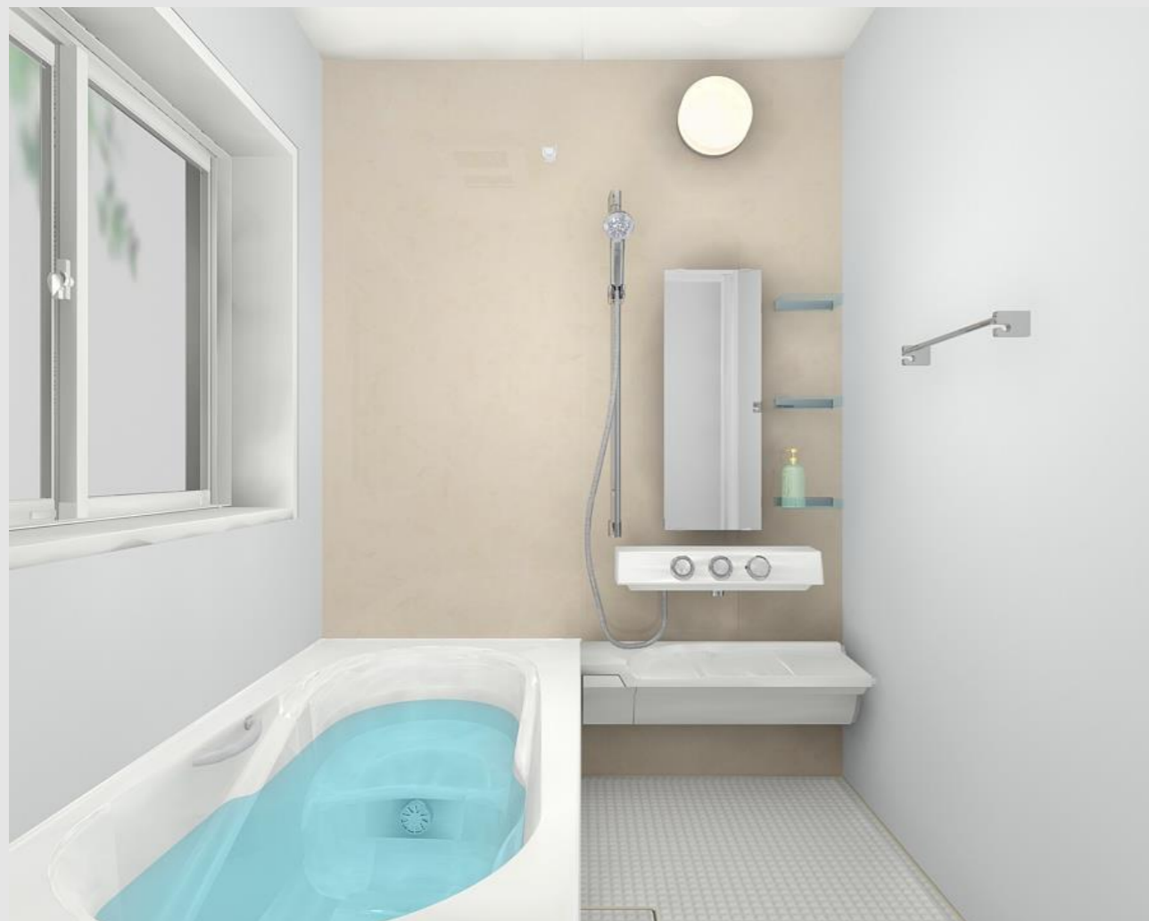
CG合成によるイメージ画像です。