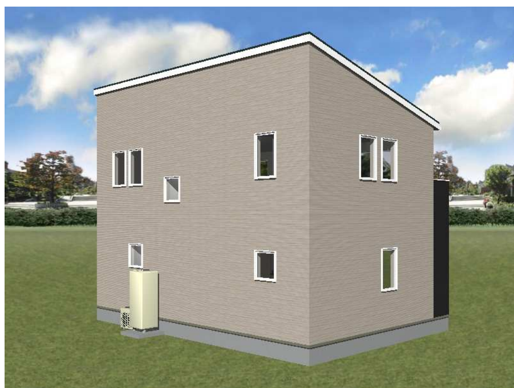
■ パース図 北西