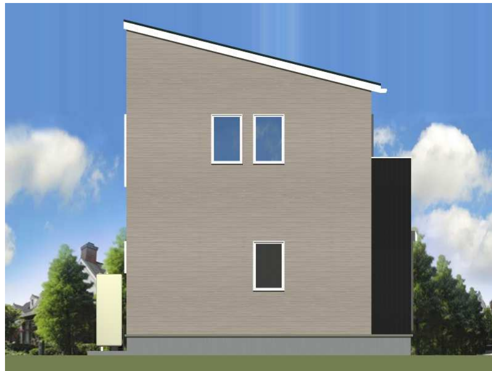
■ 立面図 西