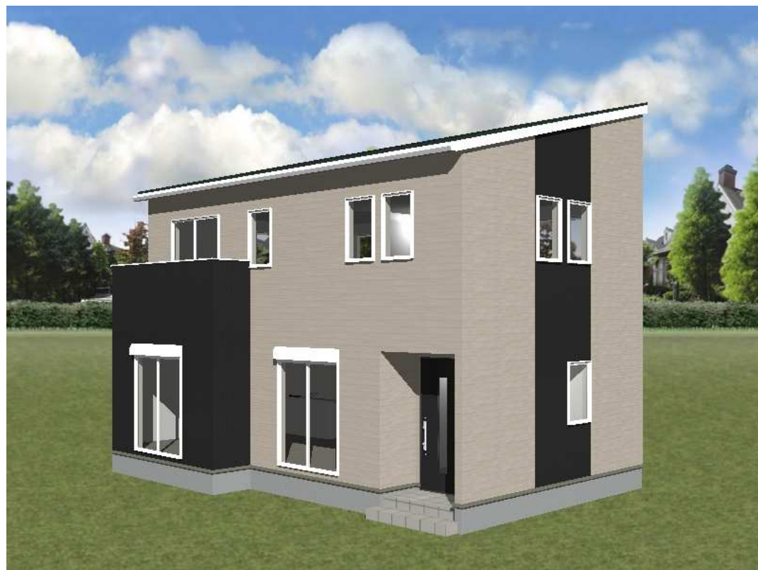
■ パース図 南東