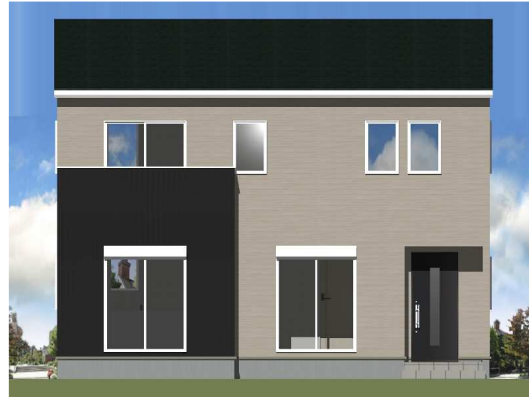
■ 立面図 南