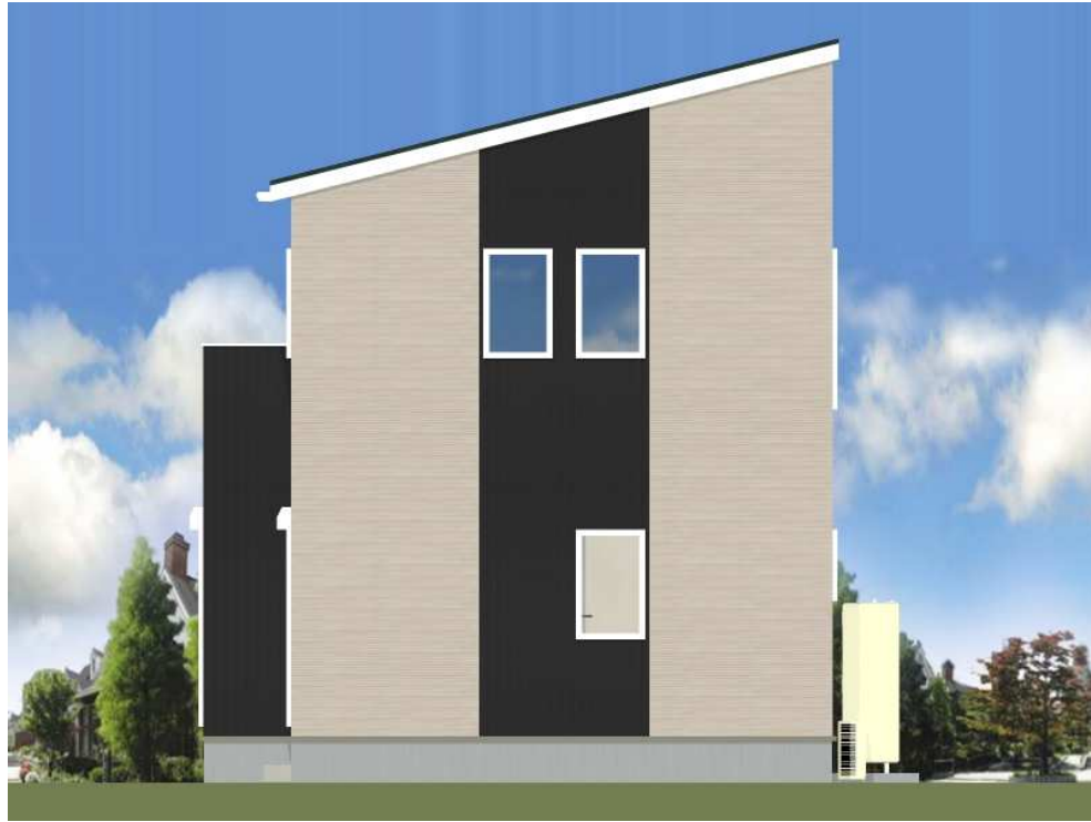
■ 立面図 東