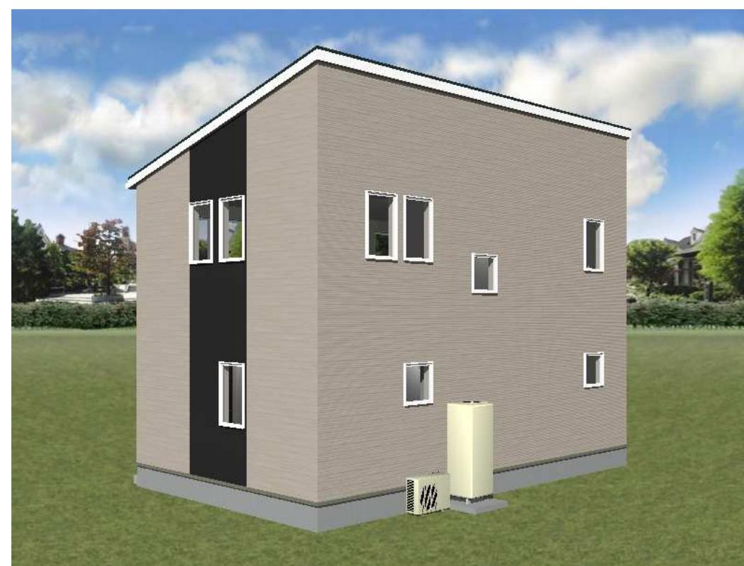
■ パース図 北東